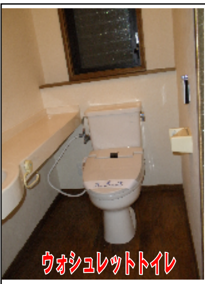
ウォシュレットトイレ