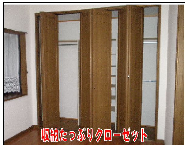
収納たっぷりクローゼット