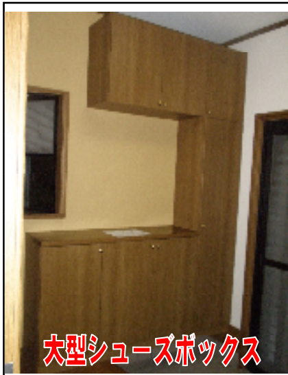
大型シューズボックス