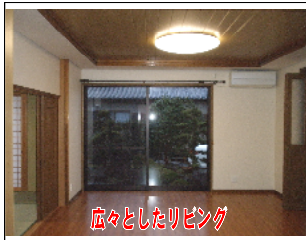
広々としたリビング