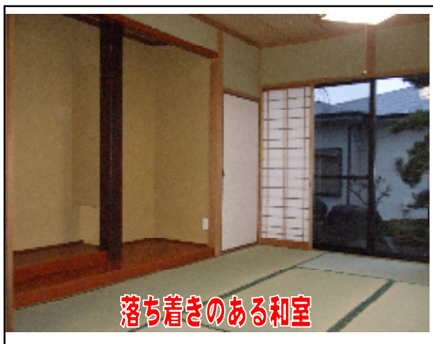
落ち着いたある和室