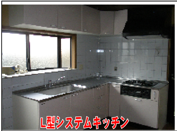
L型システムキッチン